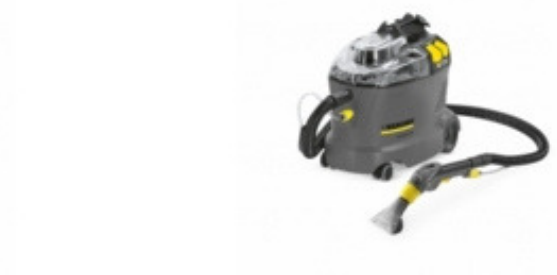
PUZZI 8/1 C